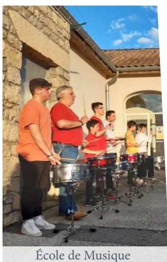
École de Musique