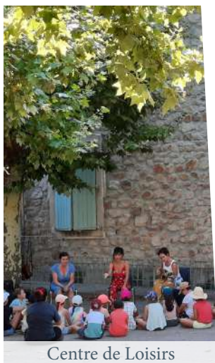
Centre de Loisirs

PAYS des VANS EN CÉVENNES COMMUNAUTÉ DE COMMUNES