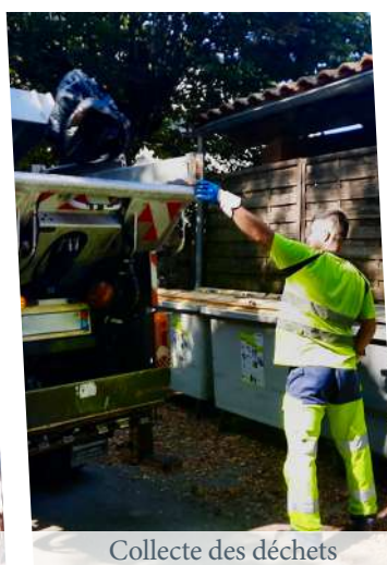
Collecte des déchets