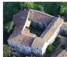
Berrias & Casteljau