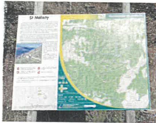
Panneau CDC Pays Beaume-Drobie