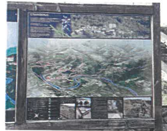
Panneau CDC Pays des Vans en Cévennes

les + carte 3D iconographie importante plusieurs textes