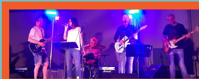
Les Old'Up au Concert du 27 mai 2023 - Centre d'Accueil - Les Vans

2 antennes : Saint-Paul-le-Jeune Les Vans